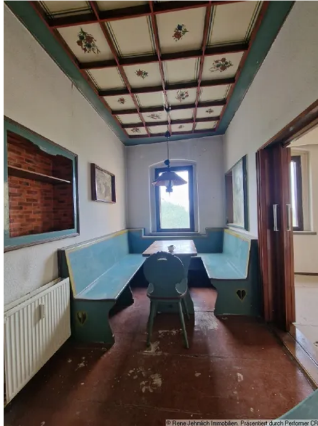
Zimmer 1 Obergeschoß