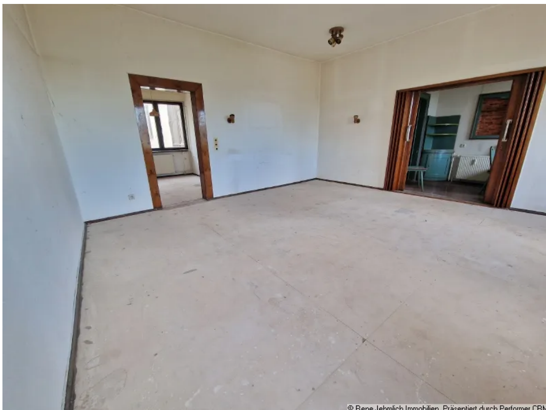
Zimmer 2 Obergeschoß