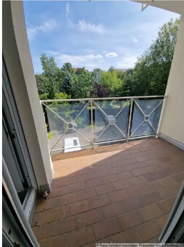
Balkon am Wohnzimmer und Schlafzimmer