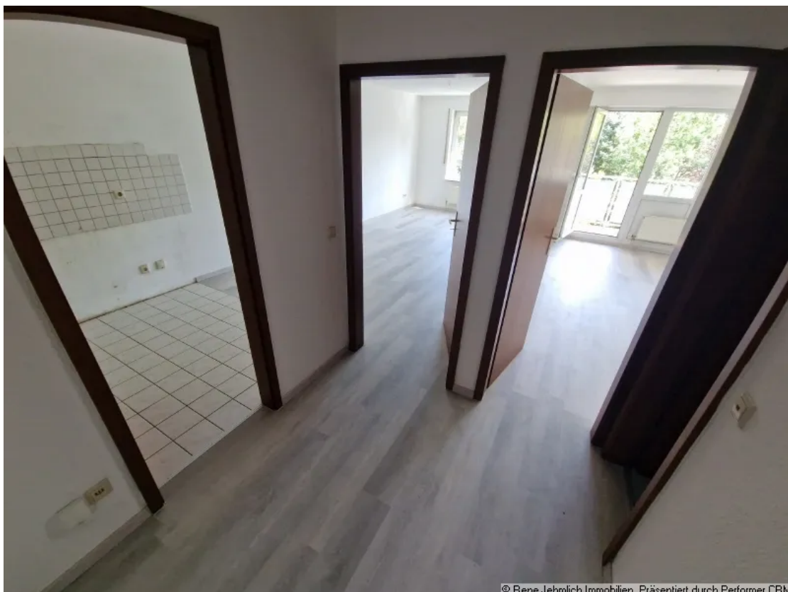
Flur mit Blick in alle Zimmer