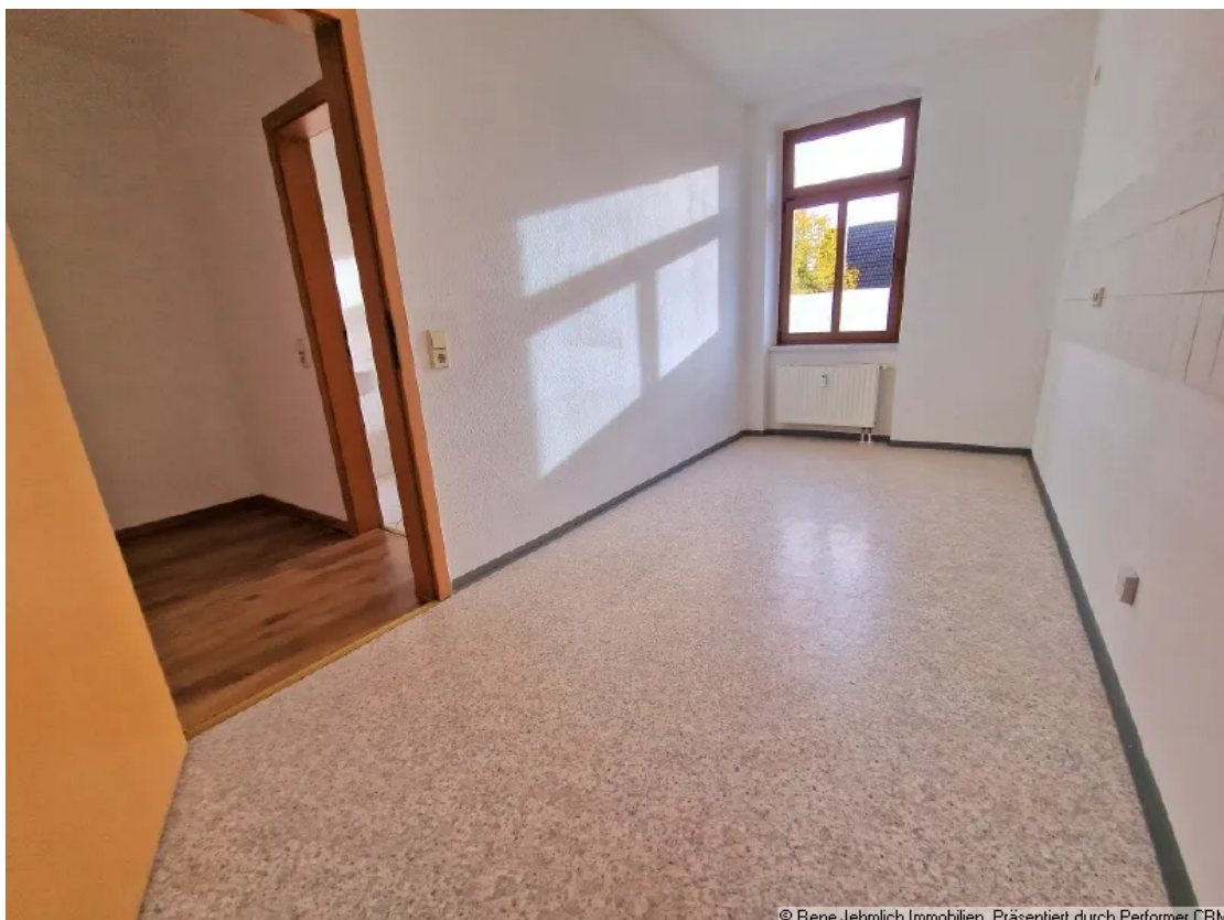
Schlafzimmer mit Balkon

© Rene Jehmlich Immobilien. Präsentiert durch Performer CRM