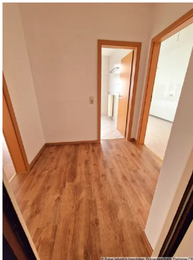
Bad mit Wanne und Fenster

© Rene Jehmlich Immobilien. Präsentiert durch Performer CRM