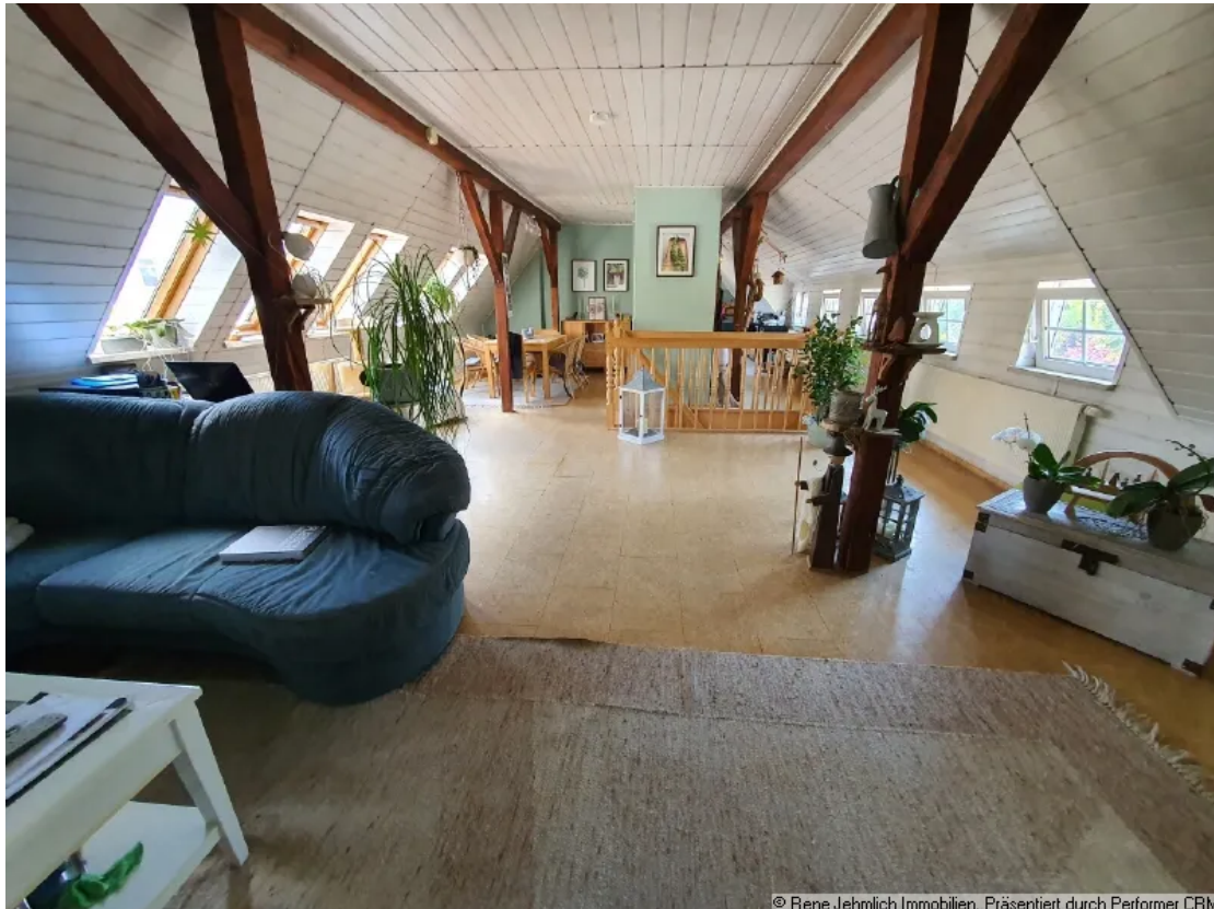
Wohnzimmer im Hinterhaus