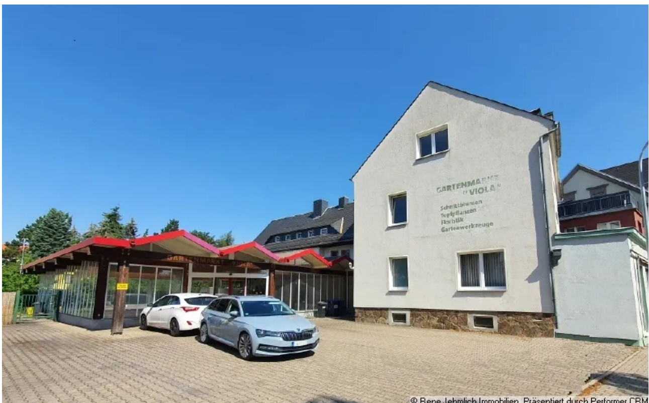
Einheit im Vorderhaus

© Rene Jehmlich Immobilien. Präsentiert durch Performer CRM