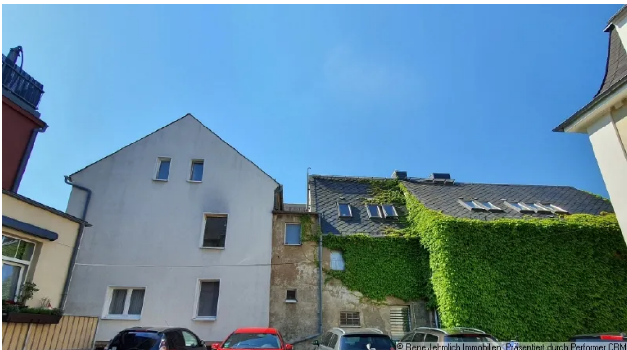
Einheit im Vorderhaus EG

© Rene Jehmlich Immobilien. Präsentiert durch Performer CRM