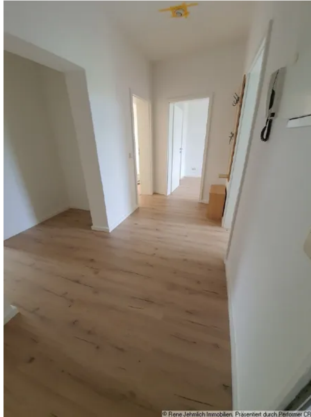
Flur Beispiel 1