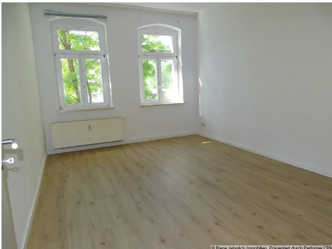
Wohnzimmer Beispiel 1