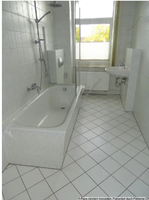
Bad Beispiel 2