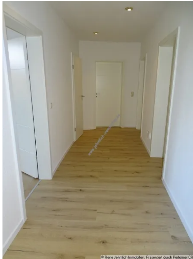
Flur Beispiel 2