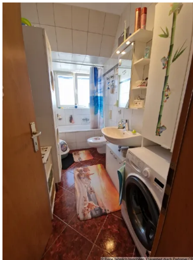
Bad mit Wanne und Fenster