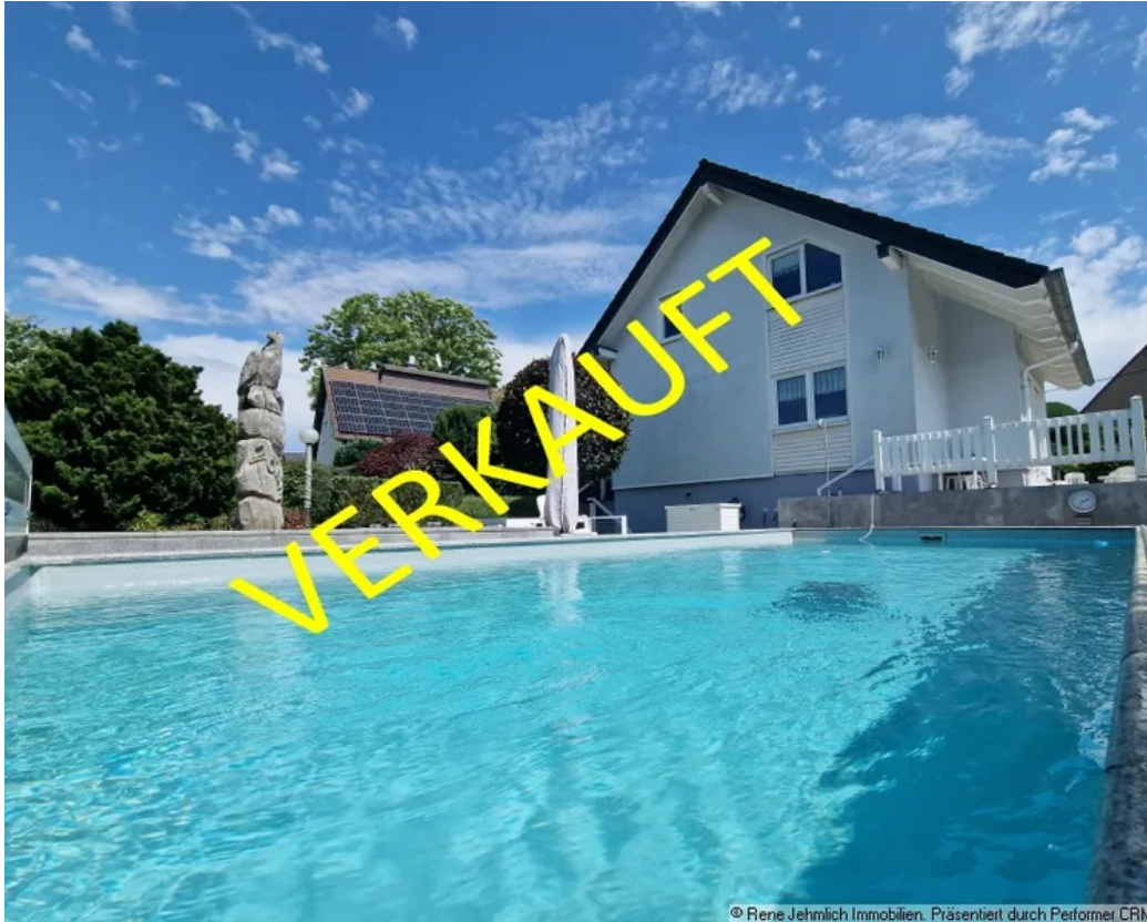
Ansicht Hinten mit Pool