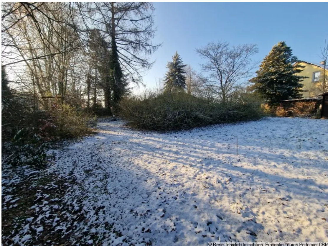
Kleiner Teil im Grundstück