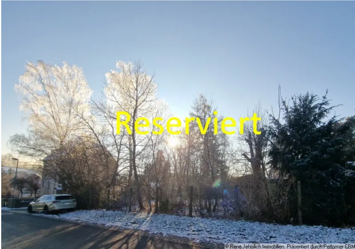
Ansicht von der Straße aus