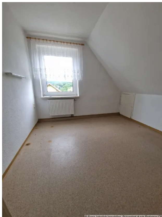
Zimmer 1 im OG

Präsentiert durch Performer CRM