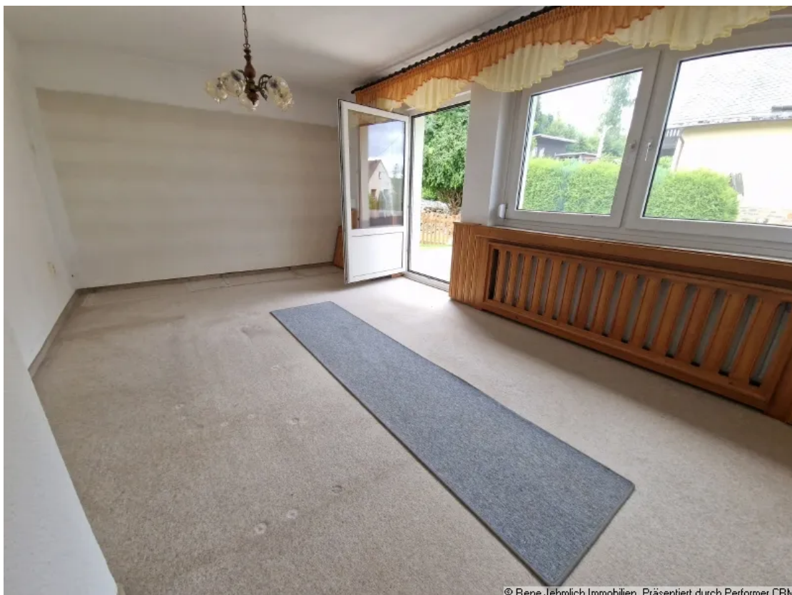
Wohnzimmer im EG