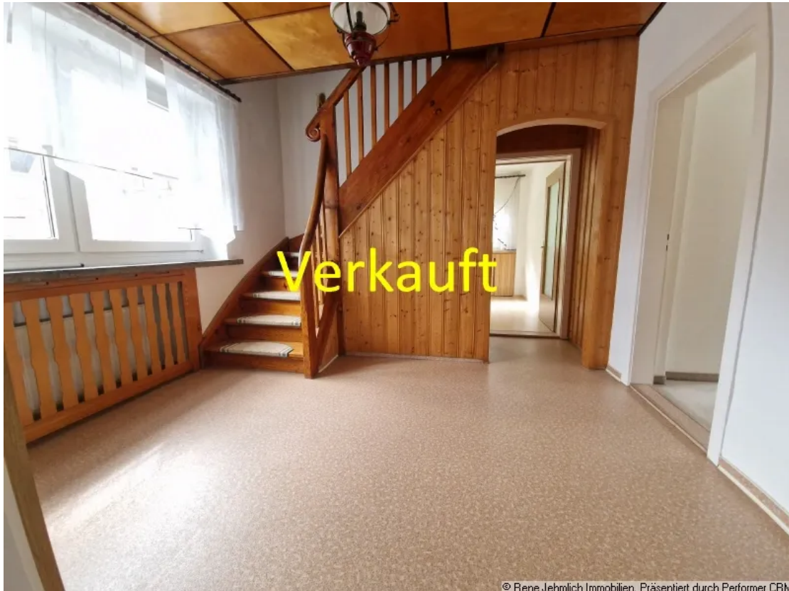
Flur im EG